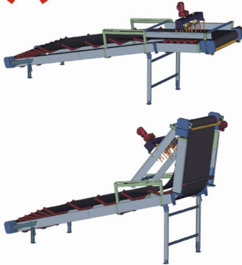
Aufklappbar ohne Demontage des Quirls.